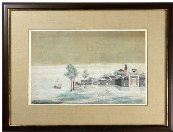
33 泥絵 長崎図 紙本 田中豊太郎旧蔵 日本の美術別巻「民藝」 (平凡社)所収 26 × 40cm 江戸期 300,000円