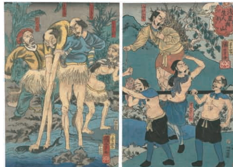
31 国芳 浅草奥山生人形 2枚続 刷良 保存良 トリミング 安政2年(1855) 80,000円