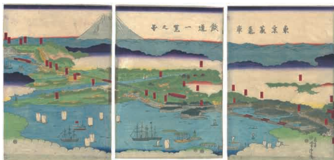
24 芳虎 東京蒸気車鉄道一覽之図 3枚続 刷良 保存良 端部糊シミ 明治4年 (1871) 60,000円