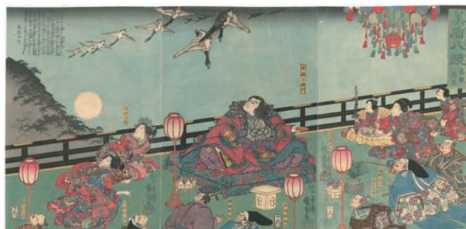
10 国芳 美盾八競 高殿落雁 3枚続 刷良 保存良 裏打 トリミング 1カ所極少虫穴 天保・弘化期 (1843-47) 85,000円