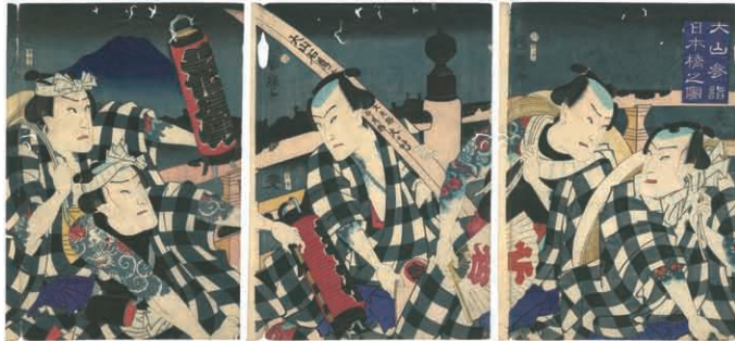
12 国輝 大山参詣日本橋之図 3枚続 刷良 保存並 トリミング 虫穴 各左端部傷み ※刺青の図 慶応2年 (1866)