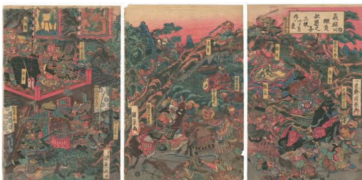
8 国兼 義経公蝦夷征罰之図 三枚つづき内ノ壹 3枚続 刷良 保存良 一部冠水シミ 端部虫穴 文化・天保期 (1815-42) 120,000円