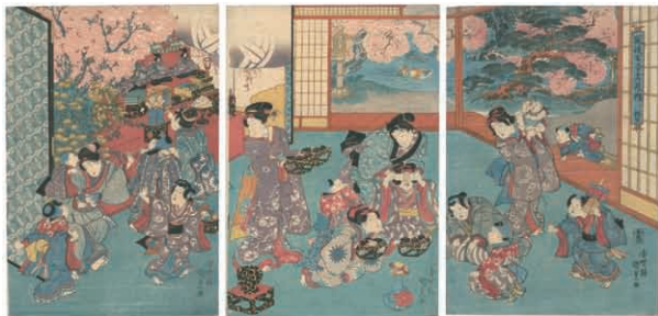
30 国貞初代 風流古今十二月ノ内 弥生 3枚続 刷良 保存良 裏打 ※雛飾りの図 江戸期 75,000円