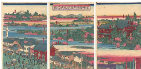
32 国政 浅草雷神門再建落成之図 3枚続 刷良 保存良 右図上部点シミ 少虫穴 補修 明治17年(1884) 60,000円