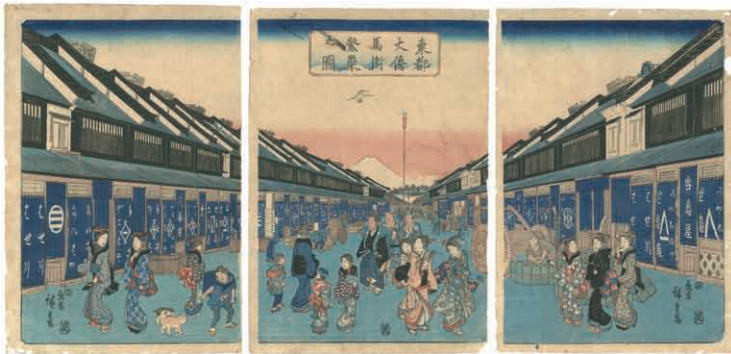
20 広重初代 東都大傳馬街繁栄之図 3枚続 刷良 保存並 マージン虫穴 中図中央部分 冠水シミ 題箋部分墨の汚れ ※犬の図 天保・弘化期 (1843-47) 100,000 円