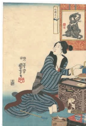
4 国芳 七婦久人 弁天 刷良 保存良 左端部少虫穴補修 弘化・嘉永期 (1847-52) 60,000 円