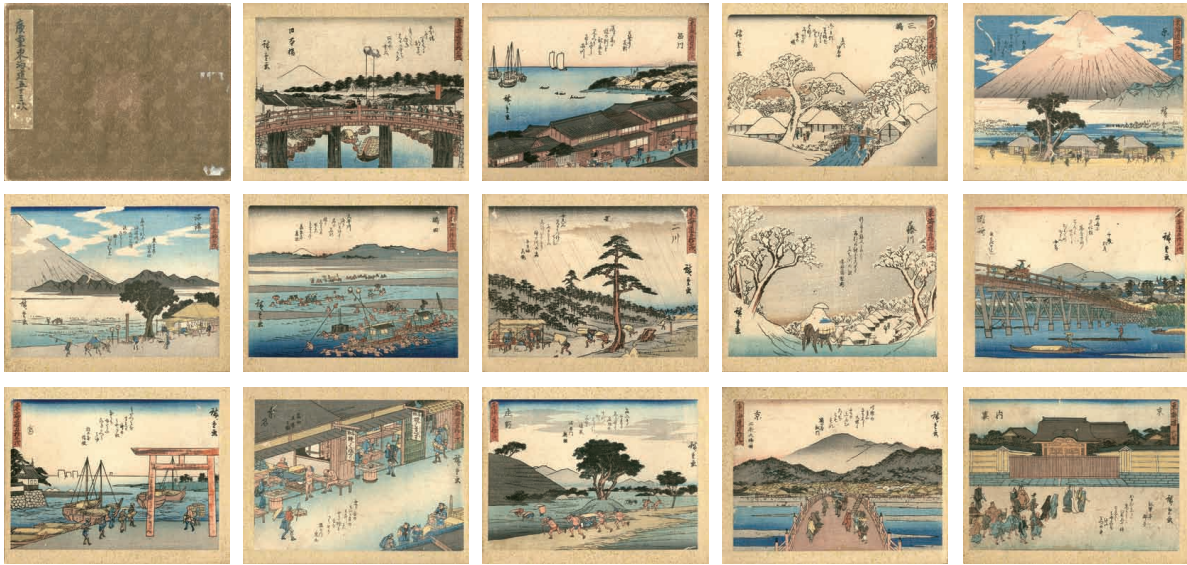
19 広重初代 東海道五拾三次 (狂歌入) 全56枚揃 小判 刷良 保存良 トリミング 少虫穴 帖仕立 14.8 × 20.5cm 天保期 (C 1840) 480,000 円