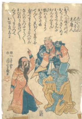
27 国芳 志いさん ばアさん 毛唐人 刷良 保存良 トリミング 虫穴 テープ跡 弘化・ 天保期 (1847-52) 65,000円