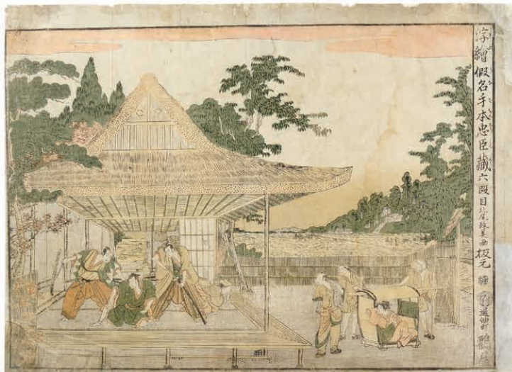
2 北尾政美 浮絵 假名手本忠臣蔵六段目 大判 刷良 保存並 シミ 部分修復 30 × 43.5cm 寛政・文化期 (1790-1804) 200,000 円