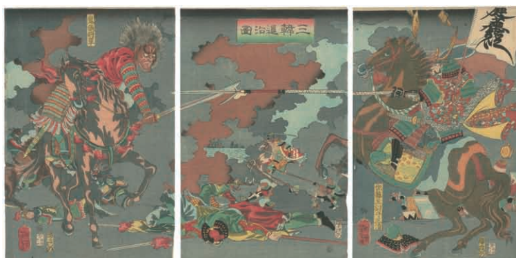
6 芳年 三韓退治図 3枚続 刷良 保存良 左図少シワ 文久3年 (1863) 250,000円