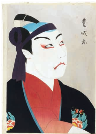
37 山村豊成 (耕花) 七世松本幸四郎の助六 木版 雲母摺 少薄いシミ 40 × 27.5cm 大正 9 年 (1920) 80,000 円