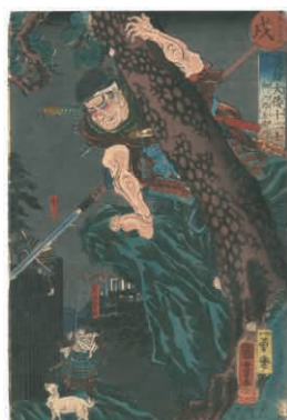
7 国芳 英雄大倭十二士 戊 畑六郎左衛門 太夫坊覺俊 刷良 保存良 トリミング ※犬の図 安政元年(1854) 40,000円