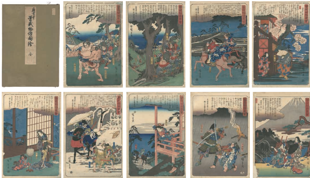
14 広重初代 曾我物語図会 全30枚 刷良 保存並 裏打 虫穴 帖仕立 天保・弘化期 (1843-47)