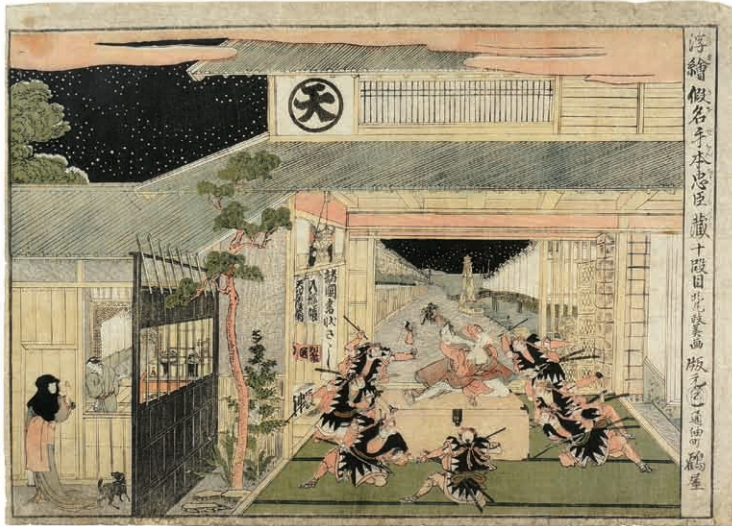
1 北尾政美 浮絵 假名手本忠臣蔵十段目 大判 刷良 保存良 端部少傷み 少シミ 30 × 43.5cm 寛政・文化期 (1790-1804) 450,000 円

〒101-0051 東京都千代田区神田神保町 1-8 山田ビル 2F・3F Tel 03-3295-0252 Fax 03-3295-0061 営業時間 10:30 ~ 18:30 日・祝日定休 E-mail info@yamada-shoten.com URL www.yamada-shoten.com Yamada Bldg. 2F・3F, 1-8 Kanda Jimbocho, Chiyoda-ku, Tokyo 101-0051 Japan Tel +81-3-3295-0252 Fax +81-3-3295-0061 Open: Mon-Sat, 10:30am-6:30 pm Close: Sun & National Holiday