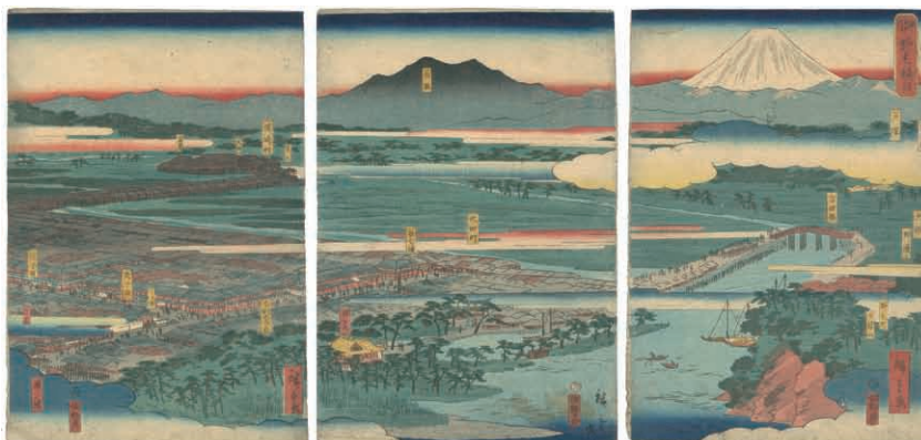
18 広重二代 神奈川野毛横浜 3枚 刷良 保存良 少シミ 少シワ 文久元年 (1861) 100,000 円