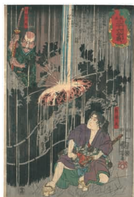
9 国芳 英名三十六合戦 熊若丸 本間三郎 刷良 保存良 トリミング極少点 虫穴 弘化・嘉永期 (1847-52) 40,000円