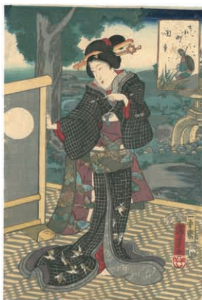
3 国芳 七小町 関寺 刷良 保存良 端部少補修 安政 2 年 (1855) 75,000 円