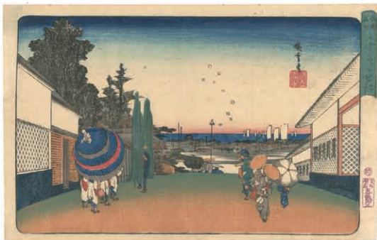
22 広重初代 江都名所 かすみがせき 刷良 保存良 裏打 マージン左部分付けミミ ※シャボン玉の図 文化・天保期 (1815-42) 80,000 円