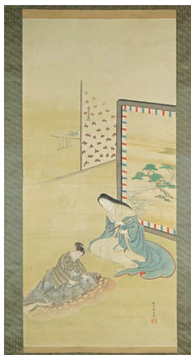
34 周延 自筆画幅 絹本 彩色 落款 印譜 保存良 顔に少汚れ 所々に経年シミ 118.5 × 56cm 江戸・明治期 120,000円