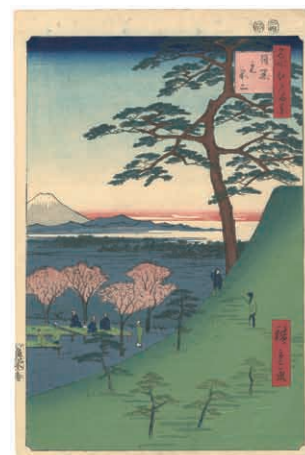
17 広重初代 名所江戸百景 目黒元不二 刷良 保存良 マージン 上部虫穴補修 安政4年 (1857) 90,000 円