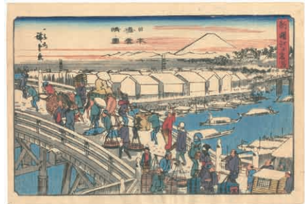
13 広重初代 新撰江戸名所 日本橋雪晴ノ図 刷良 保存良 天保11年 (1840)