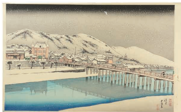
40 橋口五葉 京都三条大橋 木版 少虫穴 28 × 44.3cm 大正 9 年 (1920) 180,000 円