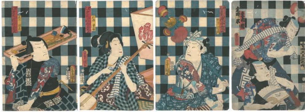
11 豊国三代 江戸自慢噂弁慶 他 4枚 刷良 保存良 トリミング 薄い汚れ 少虫穴 ※刺青・大工道具の図 文久元年 (1861)