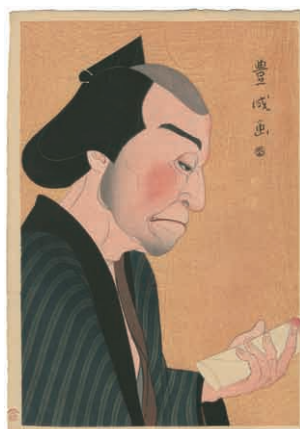
39 山村豊成 (耕花) 四世尾上松助の 加賀鳶の五郎次 木版 39.5 × 27.2cm 大正 9 年 (1920) 60,000 円