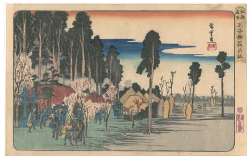
21 広重初代 江都名所 王子稲荷の杜 刷良 保存良 裏打 マージン左部分 付けミミ マージン1カ所虫穴 文化・天保期 (1815-42) 65,000 円