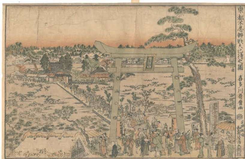
15 歌麿二代 東都不忍辨財天巳待之図 刷良 保存並 画面上部にシワ 文化・天保期 (1815-32) 300,000 円