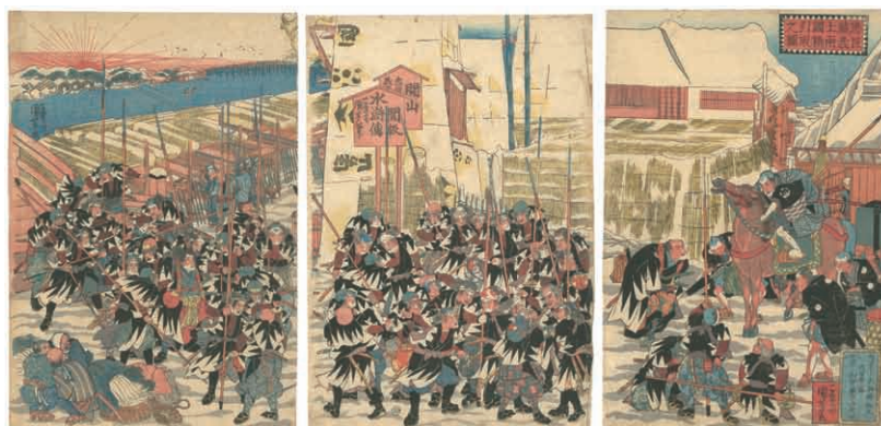
5 国芳 忠臣蔵義士両国橋引取之図 3枚続 刷良 保存良 少虫穴 少シミ 文化・天保期 (1815-42) 250,000円