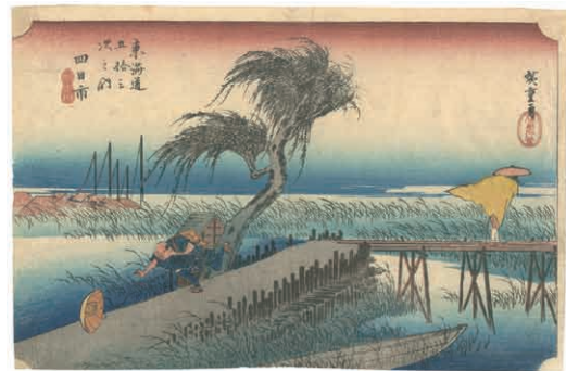
23 広重初代 東海道五十三次之内 四日市 刷良 保存良 弱い中折れ跡 一部トリミング 天保期 (C 1833-34) 100,000 円