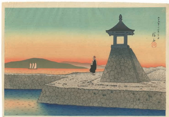
36 伊東深水 明石の曙 木版 渡辺版 極少点シミ 左上角に摺りジワ レゾネNo. 3 24.6 × 36cm 大正 5 年 (1916) 500,000 円