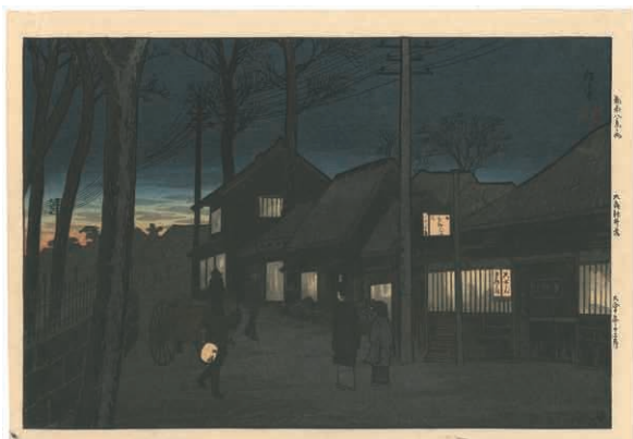
42 高橋松亭 (弘明) 都南八景之内 大森新井宿 木版 渡辺版 裏面に渡辺版画店の菱形のシール貼付 極美品 ※蕎麦やの図 24.2 × 36.2cm 大正 10 年 (1921) 500,000 円