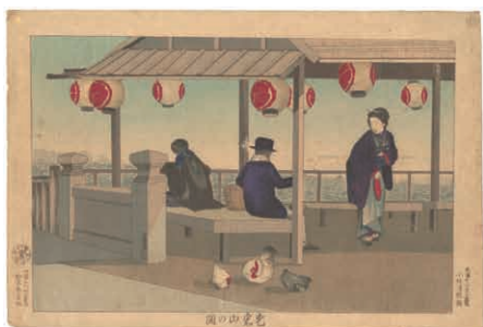
26 清親 愛宕山の図 刷良 保存良 薄いヤケ マージン 左角少薄み 明治11年 (1878) 45,000円