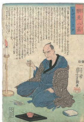
28 国芳 酔見八盃 あげあし上戸 刷良 保存良 端部 傷み 少シミ 弘化・ 嘉永期 (1847-52) 40,000円