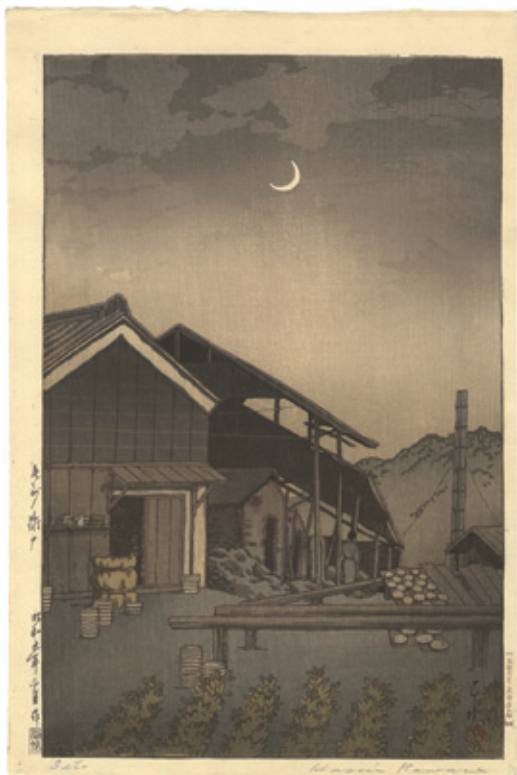
127 川瀬巴水 尾州瀬戸 木版 渡辺版 36.5 × 23.5 昭和5年(1930) 250,000 円