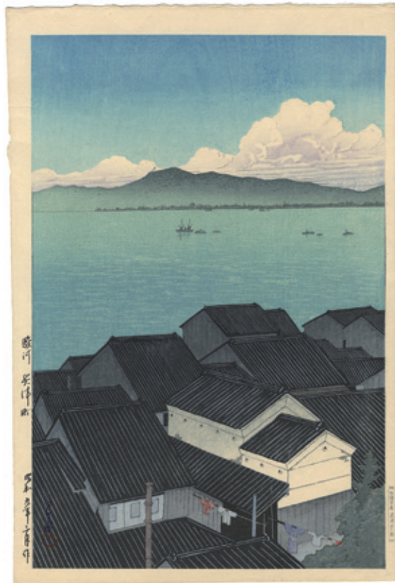
139 川瀬巴水 駿河 興津町 木版 渡辺版 36.5×24 昭和9年(1934) 480,000円