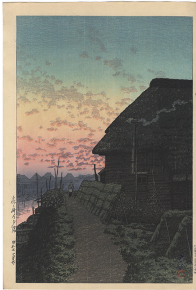
134 川瀬巴水 森ヶ崎の夕陽 木版 渡辺版 36.5 × 24 昭和7年(1932) 450,000円