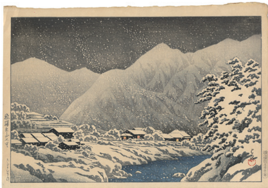
123 川瀬巴水 飛驒中山七里 木版 渡辺版 24 × 36.5 大正 13 年 (1924) 650,000 円