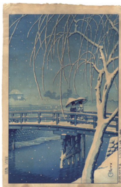
133 川瀬巴水 暮る雪 (江戸川) 木版 土井版 少薄シミ マージン シミ マージン上部一部薄ミ 36 × 23.5 昭和7年(1932) 100,000円