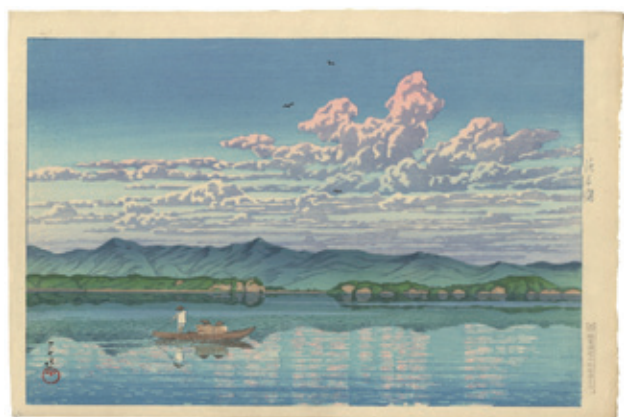
132 川瀬巴水 浜名湖 木版 渡辺版 24 × 36 昭和6年(1931) 250,000円