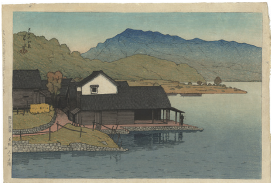
121 川瀬巴水 旅みやげ第一集 若狭 久々子湖 木版 渡辺版 マージン左端鉛筆による書込ミ 24.5 × 36.5 大正9年（1920） 900,000円