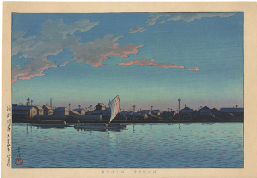
124 川瀬巴水 濱町河岸 木版 双作版画会 伊せ辰版 22.5×33.3 大正 14 年 (1925) 350,000 円