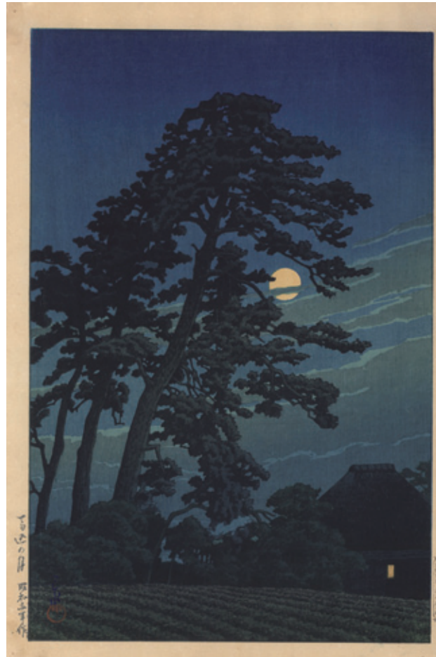
129 川瀬巴水 馬込の月 木版 渡辺版 角2カ所台紙に貼付 マージン少薄シミ 36.5 × 24 昭和5年(1930) 450,000円