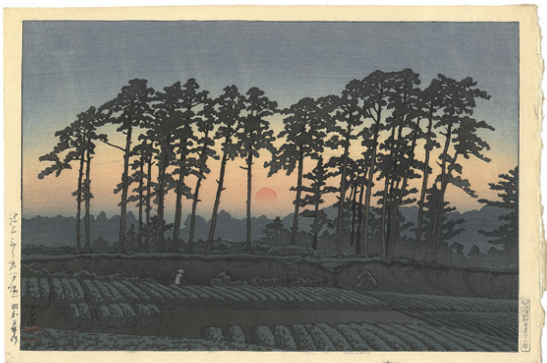
126 川瀬巴水 池上市之倉 (夕陽) 木版 渡辺版 24×36 昭和3年(1928)