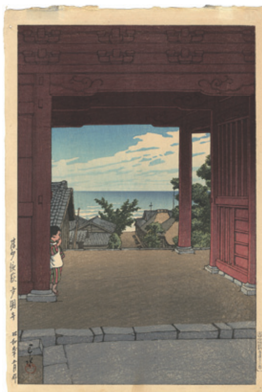
137 川瀬巴水 房州濱藪 多聞寺 木版 渡辺版 裏面上部2カ所にテープ跡 36 × 24 昭和9年 (1934) 300,000 円