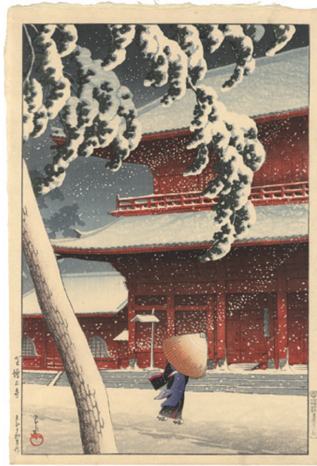
122 川瀬巴水 芝増上寺 木版 渡辺版 36.2 × 24 大正 14 年 (1925) 750,000 円