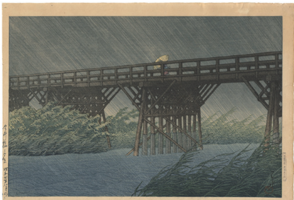
135 川瀬巴水 今井橋之夕立 木版 渡辺版 マージン薄いヤケ 24×36.5 昭和7年(1932) 400,000円