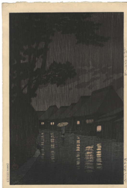
136 川瀬巴水 相州前川の雨 木版 渡辺版 36 × 24 昭和7年 (1932) 350,000 円