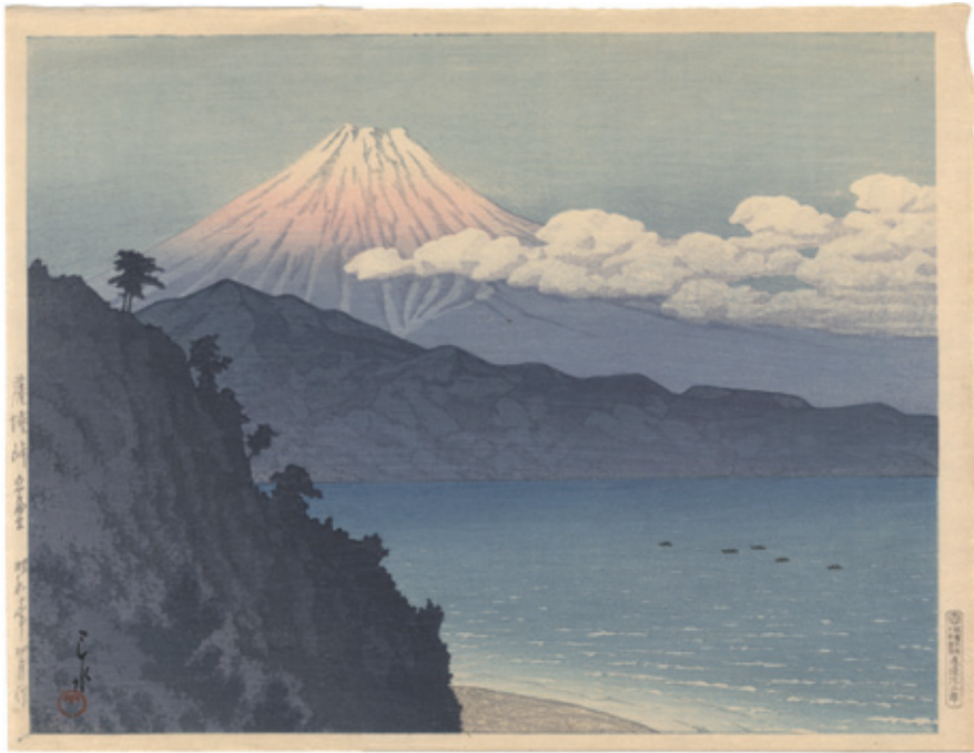
138 川瀬巴水 薩埴峠の富士 木版 渡辺版 29×37.5 昭和10年(1935) 400,000円