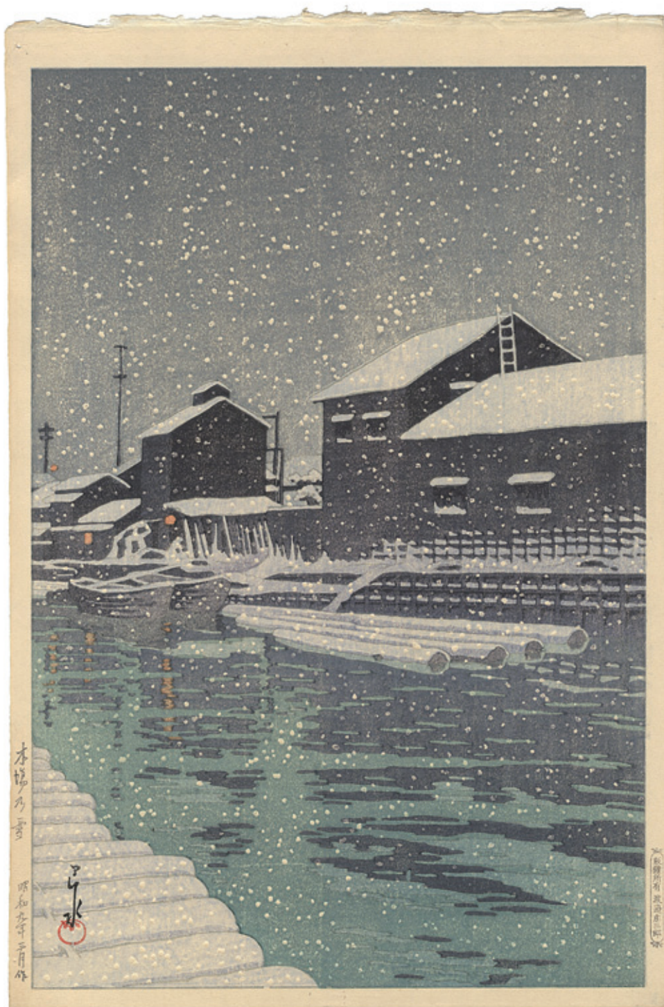
140 川瀬巴水 木場の雪 木版 渡辺版 36.3×24 昭和9年(1934)