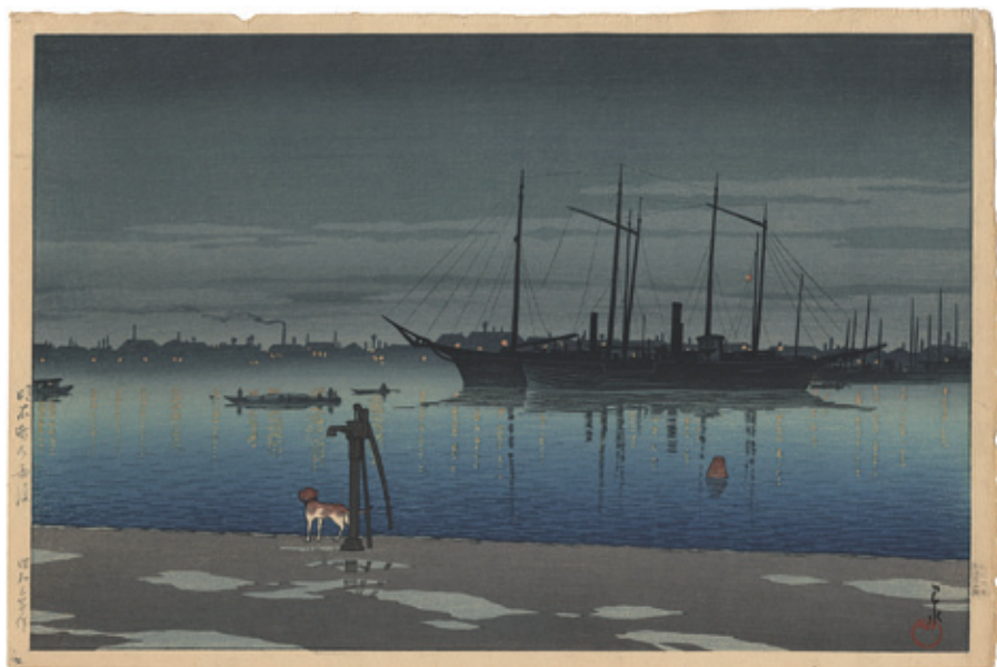
125 川瀬巴水 明石町の雨後 木版 渡辺版 24×36.5 昭和 3 年 (1928) 450,000 円