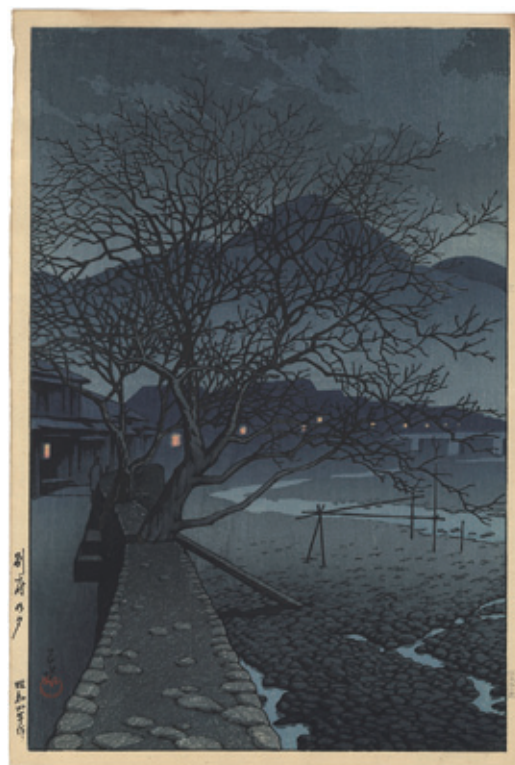
128 川瀬巴水 別府の夕 木版 渡辺版 マージン端部少シミ 36×24 昭和4年(1929) 280,000 円