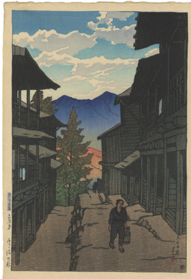
120 川瀬巴水 旅みやげ第一集 志ほ原（塩原）あら湯の秋 木版 渡辺版 36 × 24.3 大正9年（1920） 950,000円