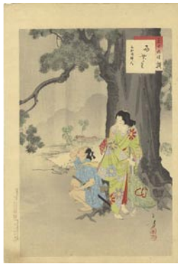
550 雨やど里 マージン左下角少シミ 8,000円