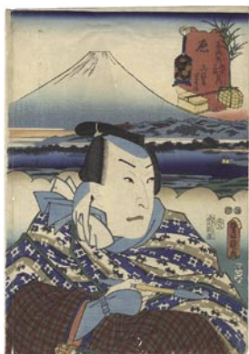
602 豊国三代 東海道五十三 次の内 原 兵服屋重兵衛 刷良 保存並 裏打 上部 シワ 少虫穴 左端傷ミ 嘉永 5 年 (1852) 8,000 円