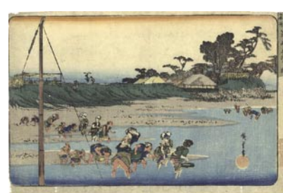
596 広重初代 江都名所 洲崎しほ干狩 刷並 保存良 マージン極少虫穴 天保期 20,000 円