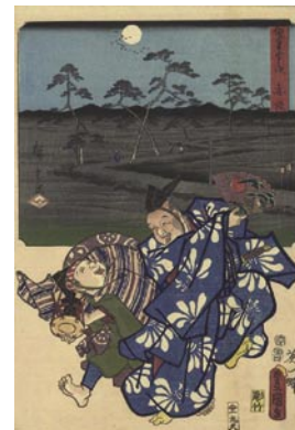
605 広重初代・豊国三代 雙筆五十三次 赤坂 刷良 保存良 安政 2 年 (1855) 35,000 円