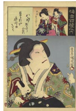
509 八汐 6,000 円