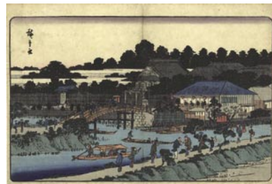
599 広重初代 東都名所 柳嶋妙見堂 刷良 保存良 中折レ 少シミ 安政頃 (C1858) 18,000 円