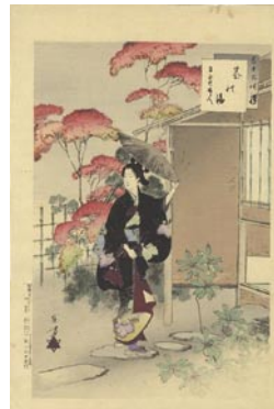
544 茶の湯 マージン少シミ 8,000 円