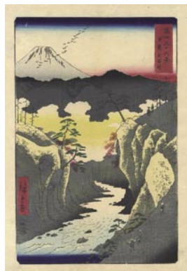
607 広重初代 富士三十六景 甲斐犬目峠 刷良 保存良 安政 5 年 (1858) 60,000 円