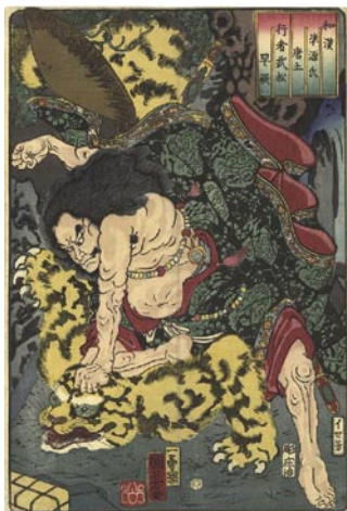
570 国芳 和漢準源氏唐土行者武松早厥 刷良 保存良 中折レ 安政2年 (1855) 35,000 円