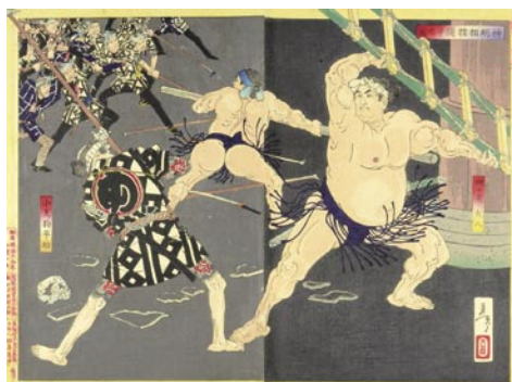
576 神明相撲闘争之図 裏打 端部折レ ※刺青の図 明治 19 年 (1886) 35,000 円