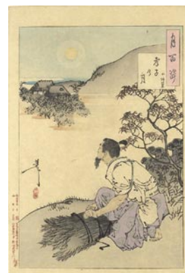
585 芳年 月百姿 考子乃月 小野篁 刷良 保存良 明治 22 年 (1889) 15,000 円