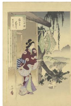
548 編笠茶屋 ※犬の図 8,000 円