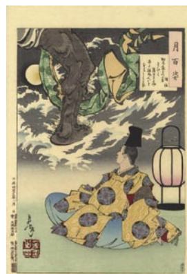
584 芳年 月百姿 から衣うつ声聞けば月 きよみまだねぬ人を空 にしるかな 経信 刷良 保存良 明治 19 年 (1886) 20,000 円