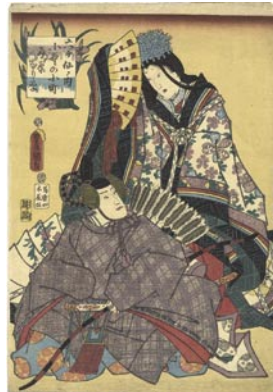
567 豊国三代 六ヶ仙ノ内 小野小町 在原業平 刷良 保存良 安政元年 (1854) 15,000 円