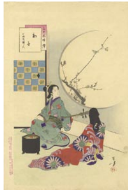
539 初音 8,000 円