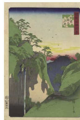
609 広重二代 諸国名所 百景 武蔵秩父山中 刷良 保存良 台紙に 貼付 安政 6 年 (1859) 35,000 円