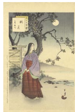
529 眺月 8,000 円