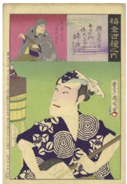
511 飴屋湯平 10,000 円