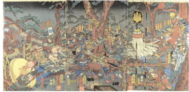
565 芳幾 壽永二年木曾義仲平将知度俱利迦羅谷大合戦 3枚続 刷良 保存良 中折レ 安政4年 (1857) 18,000 円