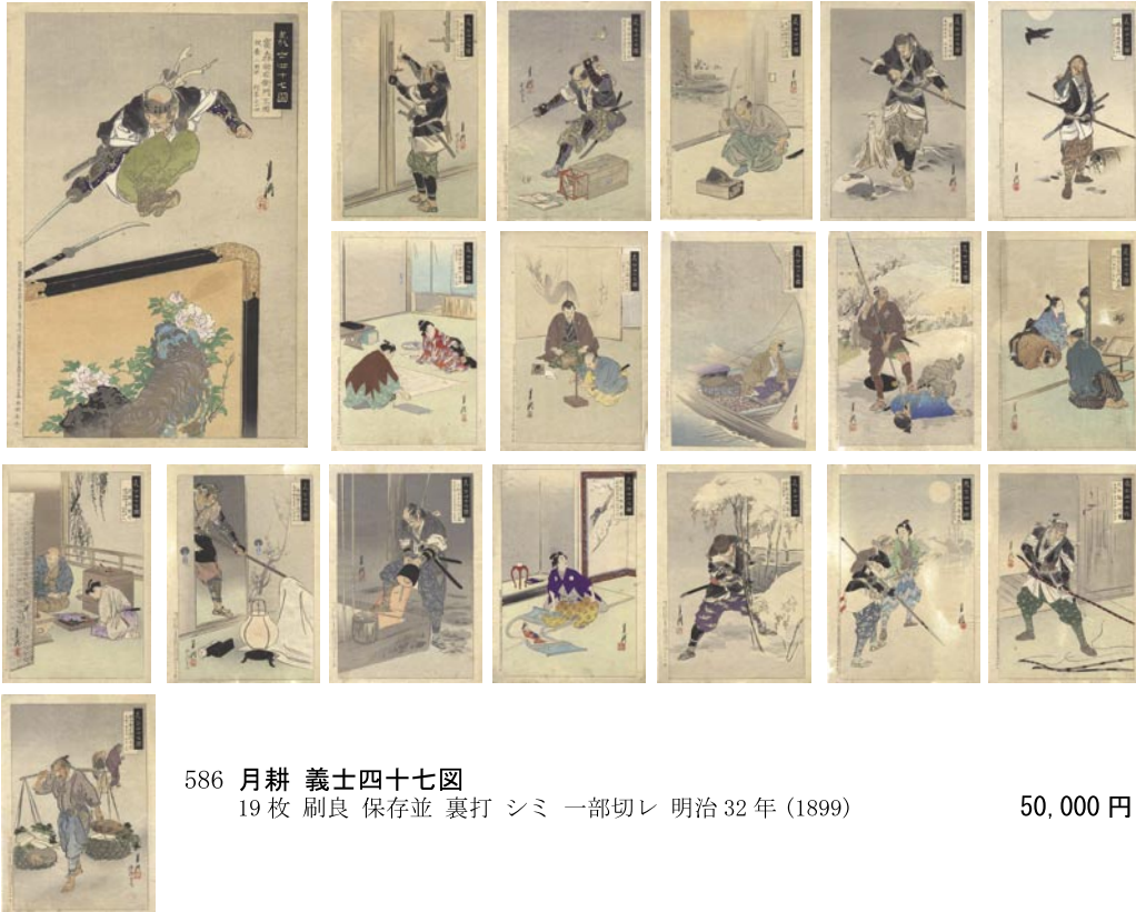
586 月耕 義士四十七図 19枚 刷良 保存並 裏打 シミ 一部切レ 明治32年(1899)