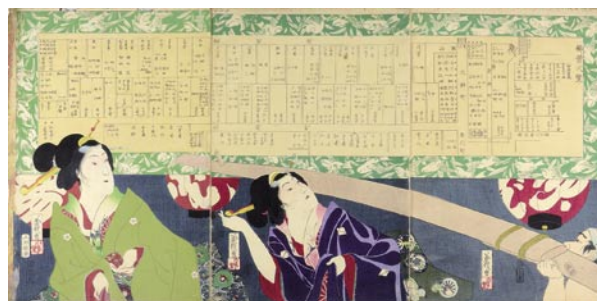
525 菊哉 柳葉弑覽 3枚続 刷良 保存良 右図下角少切レ 1ヶ所少点シミ 左図マージン傷ミ 明治4年 (1871) 20,000 円