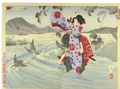
577 鬼神於松四郎三郎を害す図 裏打 明治 19 年 (1886) 25,000 円