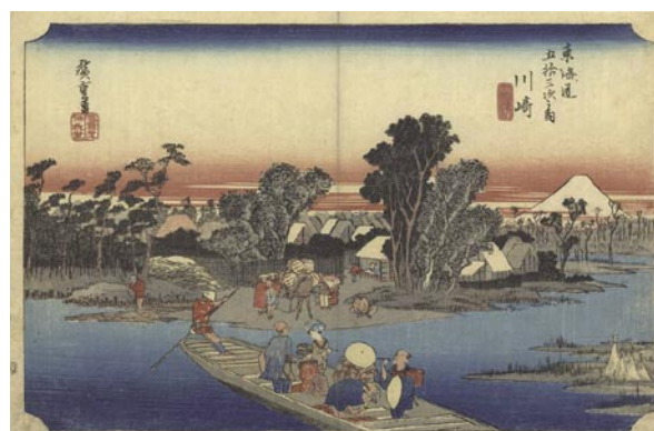
593 広重初代 東海道五十三次之内 川崎 刷良 保存良 中折レ 天保期 (C1834) 150,000 円