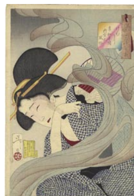
523 芳年 風俗三十二相 けむたそう 享和年 間内室之風俗 刷良 保存良 明治21年 (1888) 16,000 円