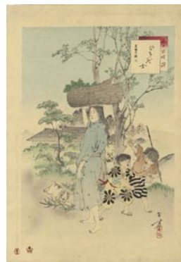
549 ひさご女 8,000 円