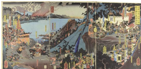
561 芳虎 治承四年兵衛佐頼朝石橋山義旗揚図 3枚続 刷良 保存良 中折レ 少虫穴 右図左端少シワ 弘化・嘉永期(1847-52) 20,000円