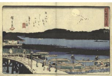
597 広重初代 江戸名所隅田川之月 刷良 保存良 中折レ 極少虫穴 初版 (有田屋版) 嘉永頃 (C1853) 20,000 円