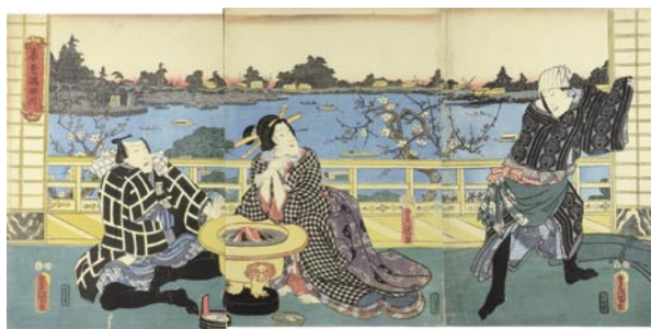
610 豊国三代 春色隅田川 3 枚続 刷良 保存良 左端折レ ※火鉢の図 安政 3 年 (1856) 35,000 円