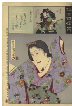
516 扇折早百合 マージン右角汚レ 8,000 円