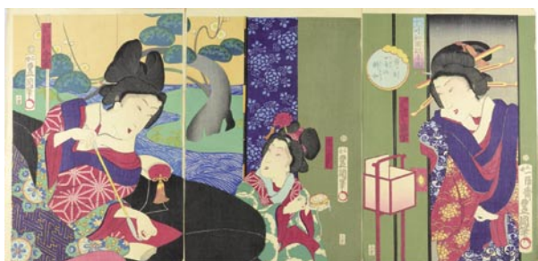
524 豊国四代 十二時秘図試年丸 寅ノ刻 口舌の解和 3枚続 刷良 保存良 ※行灯・懐中時計の図 明治3年 (1870) 45,000 円