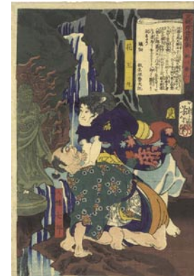
569 芳年 東錦浮世稿談 箱王丸 刷良 保存良 慶応3年 (1867) 25,000 円