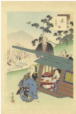
538 遊山 8,000 円