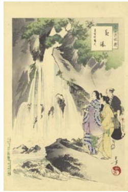
535 観瀑 8,000 円