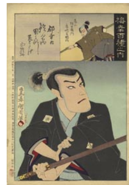
514 郡幸内 マージン1ヶ所シミ 8,000 円