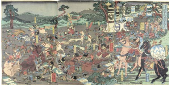
564 芳員 建武二年新田足利津国豊嶋合戦 3枚続 刷良 保存良 安政元年 (1854) 25,000 円