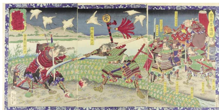
571 芳年 豊臣昇進録 嶋左近友之 3枚続 刷良 保存良 明治元年 (1868)