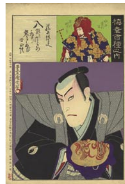
513 藤井紋太夫 8,000 円