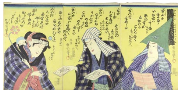
517 国周 難題口呂都一節 3枚続 刷良 保存良 少シミ 右図左下角少傷ミ 15,000 円