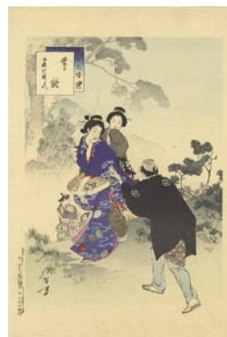
528 茸狩 1ヶ所極少点シミ 8,000 円