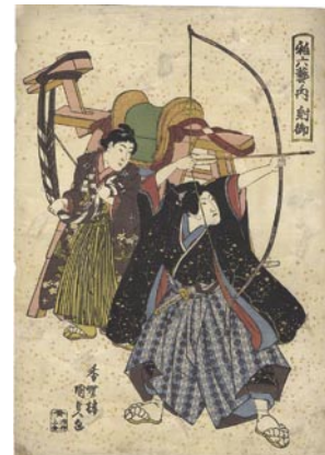
519 国貞初代 稚六藝ノ内 射御 刷良 保存並 虫穴補修 天保頃 15,000 円