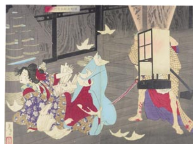
579 佐野治朗左衛門の話 トリミング 明治 19 年 (1886) 12,000 円