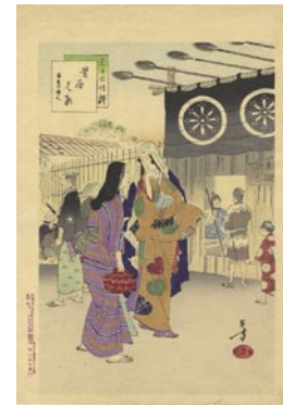
557 芝居見物 8,000円