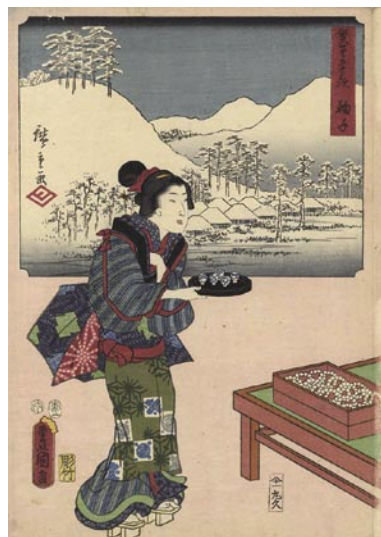
600 広重初代・豊国三代 雙筆五十三次 鞠子 刷良 保存良 1ヶ所極少 虫穴 マージン右端折レ 安政元年 (1854) 75,000 円