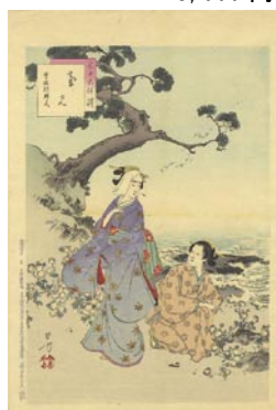
532 菊見 8,000 円