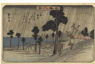
595 広重初代 金澤八景 小泉夜雨 刷良 保存良 薄いシミ 天保 6 年頃 (C1835) 30,000 円