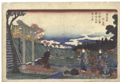
598 英泉 江都三囲稲荷之前堤之景 刷並 保存良 天保頃 35,000 円