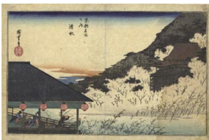
594 広重初代 京都名所之内 清水 刷良 保存並 中折レ 右部分 1/3 冠水 シミ 天保 5 年頃 (C1834) 10,000 円