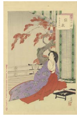
552 詠歌 8,000円