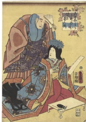
566 豊国三代 六ヶ仙ノ内 小野小町 僧正遍照 刷良 保存良 安政元年 (1854) 12,000 円