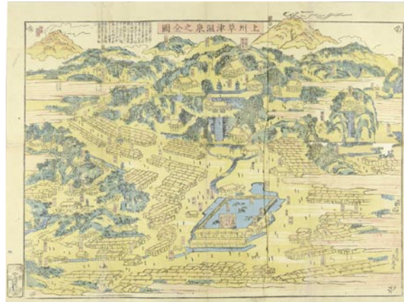
588 英泉 上州草津温泉之全図 刷良 保存良 裏打 折レ 31.5 × 43.5 江戸期 45,000円