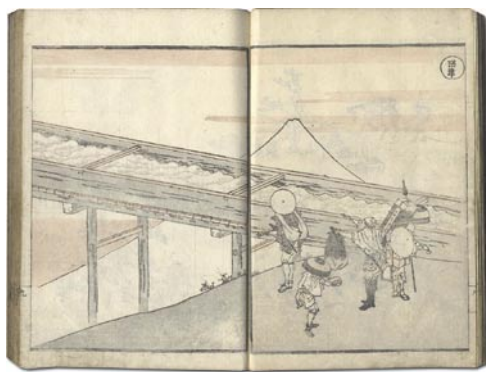
589 北斎 五十三次北斎道中画譜 (全) 刷良 保存良 最初の数頁の下部部分少汚レ・擦レ 23 × 16.4 天保6年(1835) 120,000円