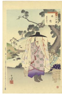
536 旅路 8,000 円