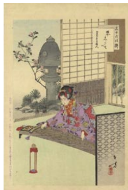
547 琴志らべ 8,000 円