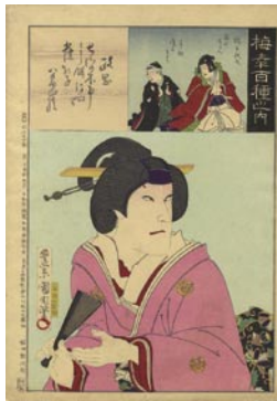
507 政岡 8,000 円