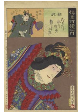
510 姐妃 10,000 円