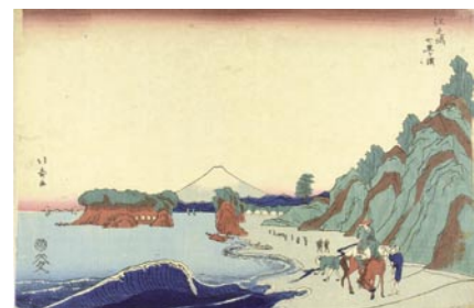
590 北寿 江ノ嶋七里ヶ濱 刷良 保存良 少虫穴補修 文化期(1818-29) 35,000円