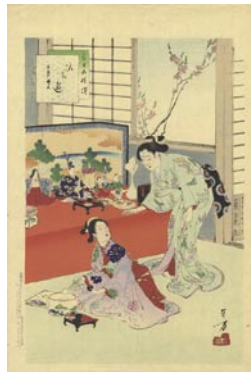
543 ひな遊 8,000 円