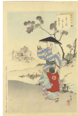
540 そぞろあるき 8,000 円