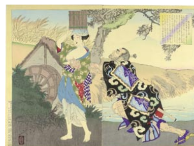
582 芳年 高島大井子の話 2枚続 刷良 保存良 裏打 明治 22 年 (1889) 15,000 円