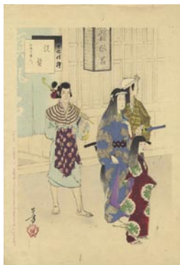
558 洗髪 8,000円