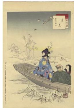
555 雪見 8,000円