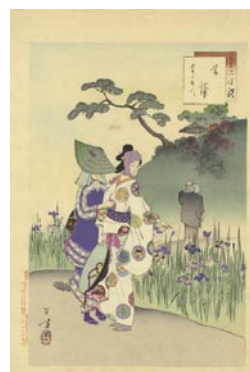
533 菖蒲 1ヶ所極少汚レ 8,000 円