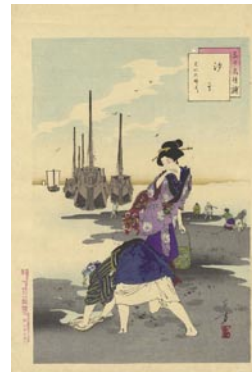
556 汐干 8,000円