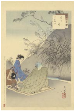
534 虫の音 8,000 円