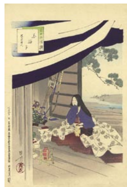
527 白拍子 8,000 円