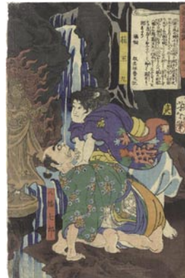
568 芳年 東錦浮世稿談 桃川燕山 箱王丸 刷良 保存良 トリミング 端部シワ 慶応3年 (1867) 15,000 円