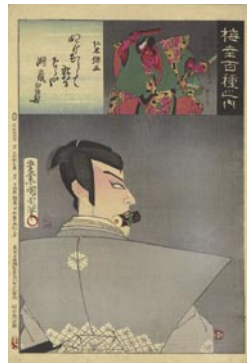
508 仁木弾正 10,000 円