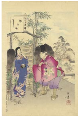
554 惣恵文 8,000円