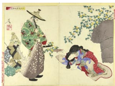
580 太田道灌初テ歌道ニ志ス図 裏打 赤点シミ 明治 20 年 (1887) 20,000 円