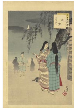
551 辻君 8,000円