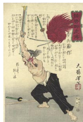
573 芳年 競勢酔虎傳 歩兵藤作 刷良 保存良 少シワ 明治 7年 (1874) 25,000 円