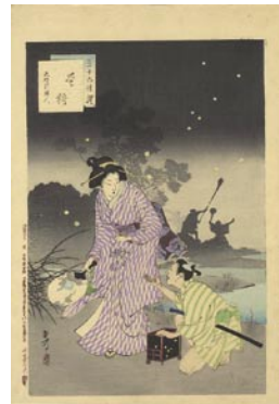
545 蛭狩 8,000 円