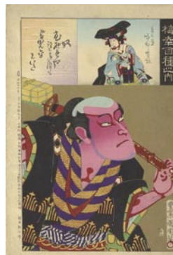
512 奴 8,000 円