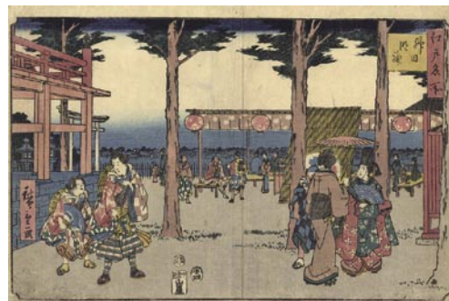
601 広重初代 江戸名所 神田明神 刷良 保存良 中折レ 安政元年 (1854) 20,000 円