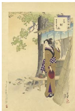
526 茶酌女 8,000 円