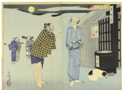
575 於富与三郎話 裏打 ※犬の図 明治 18 年 (1885) 35,000 円