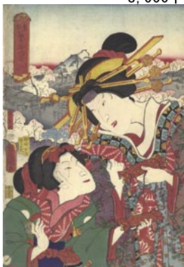
606 豊国三代・広景 東都 富士三十六景 浅草寺 刷良 保存良 トリミング 左端少傷ミ 顔部分に少シミ 万延元年 (1860) 15,000 円