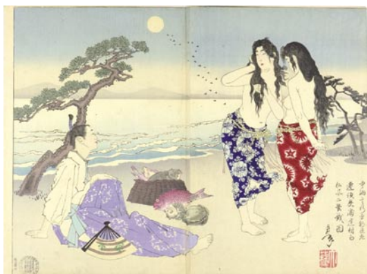
583 芳年 中納言行平朝臣左遷須磨浦逢村雨松風二蟹戯図 2枚続 刷良 保存良 裏打 端部折レ 極薄いシミ 明治 19 年 (1886) 35,000 円