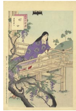
537 侍女 8,000 円