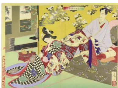
578 於さめ遊女を学ぶ図 裏打 数ヶ所少赤シミ 明治 19 年 (1886) 25,000 円