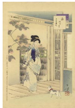
559 湯河の里 ※猫の図 15,000円