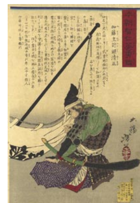
574 芳年 本朝智仁英雄鑑 加藤主計頭清正 刷良 保存良 少点シミ 明治11年 (1878) 30,000 円