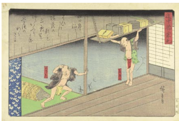
592 広重初代 道中膝栗毛 四日市泊まり 刷良 保存良 蔦重版 マージン左角少補修 天保頃 40,000 円