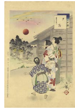
553 夕陽 8,000円