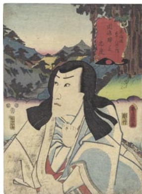
603 豊国三代 東海道五十三次 ノ内 岡部驛ノ上 忠度 刷良 保存並 トリミング 綴ジ穴 汚レ 嘉永 5 年 (1852) 6,000 円