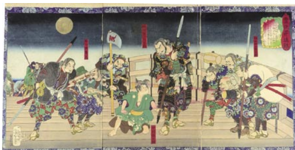
572 芳年 豊臣昇進録 3枚続 刷良 保存並 トリミング 2ヵ所虫穴 中図右端 傷ミ 明治期 25,000 円