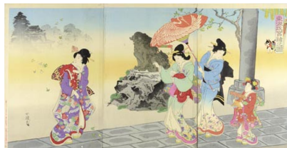
560 小国政 東源氏宮詣之図 3枚続 刷良 保存良 中折レ 中図左端少冠水シミ 明治 28年(1895) 25,000円