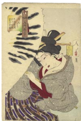
521 芳年 風俗三十二相 さむそう 天保年間深川 仲町藝者風俗 刷良 保存良 明治21年 (1888) 25,000 円