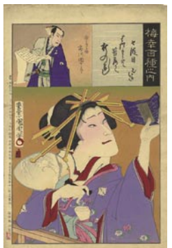
515 七段目 マージン薄い汚レ 8,000 円