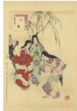
541 手鞠 8,000 円