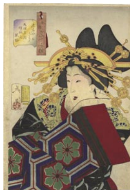
522 芳年 風俗三十二相 しなやかそう 天保 年間傾城之風俗 刷良 保存良 汚レ 明治 21年 (1888) 12,000 円