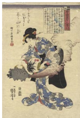
520 国芳 譬諭草をしへ 早引 蚊 (か) 刷良 保存良 折レ 綴ジ穴 天保・弘化期 (1843-47) 35,000 円