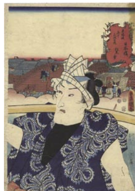
604 豊国三代 東海道五十三 次ノ内 日本橋 松魚売 刷良 保存良 右角シミ 極少虫穴 嘉永 5 年 (1852) 10,000 円