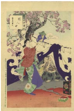
542 樽人形 8,000 円