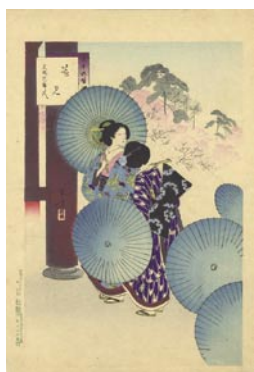
530 花見 8,000 円