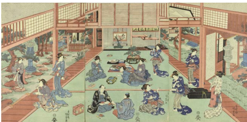
518 国貞初代 作品 3枚続 刷良 保存良 文化・天保期 (1815-42) 50,000 円