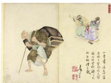
581 芳年 芳年漫画 舌切雀 2枚続 刷良 保存良 裏打 少シミ 左図下部少汚レ マージン左端折レ 明治 18 年 (1885) 25,000 円