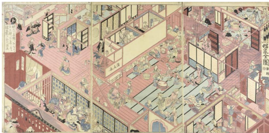
591 国直 娼家全図 新版 3枚続 刷良 保存良 左図左下角少傷ミ補修 ※髪結い・眼鏡の図 文化・天保期 (1815-42) 120,000 円