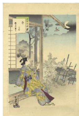
531 卯月 8,000 円