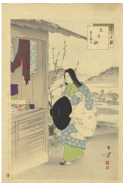
546 見世棚 マージン少シミ 8,000 円