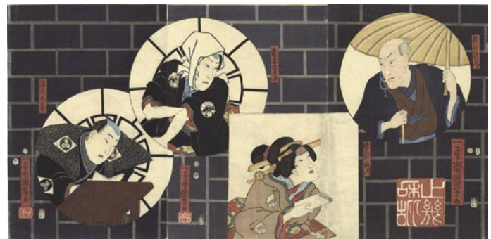
331 国芳 道行故郷の初雪 3 枚続 刷良 保存良 安政元年 (1854) 35,000 円