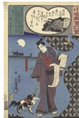
380 豊国三代 周防内侍 / 白井権八 ※犬の図 6,000 円