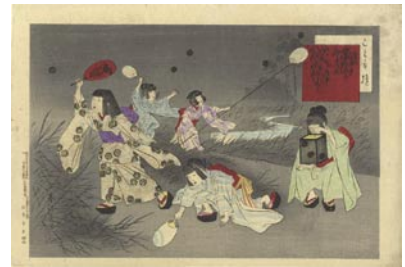
351 春汀 子ども遊 蛸狩 刷良 保存良 マージン少シミ 明治29年 (1896) 10,000円