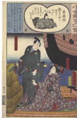
375 豊国三代 崇徳院 / 宮城阿蘇次郎 / みゆき 7,000 円