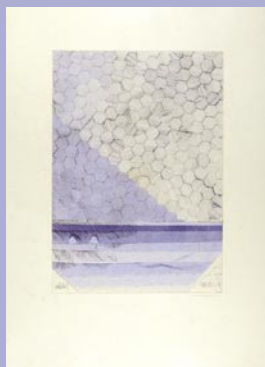
248 薄いシミ 28,000 円