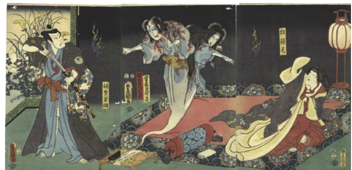
332 豊国三代 芝居絵 (鎌田又八亡霊他) 3 枚続 刷良 保存良 安政 2 年 (1855) 50,000 円