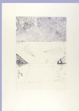
253 マージン 極薄いシミ 30,000 円