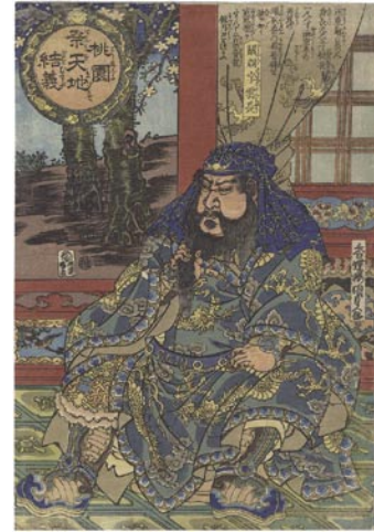
361 国貞初代 桃園祭天地結義 關羽字雲長 刷良 保存良 文化・天保期 (1815-42) 45,000 円