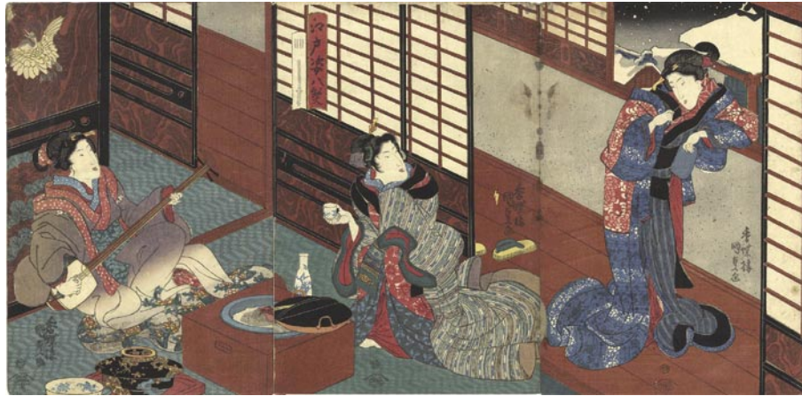
307 国貞初代 江戸姿八契 3枚続 刷良 保存良 裏打 少シミ 文化・天保期 (1815-42) 100,000 円