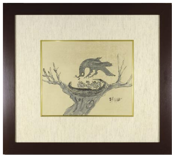
247 バーナード・リーチ 自筆画 巢守図 紙 淡彩 サイン シミ 浜田晋作シール 27.5 × 33.5 昭和 10 年 (1935) 額装 250,000 円