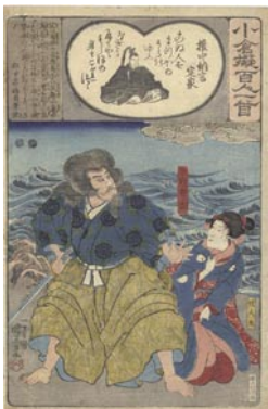
377 国芳 権中納言定家 / 日向勾當 / 娘人丸 6,000 円