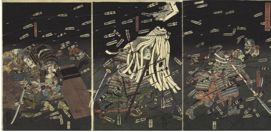
358 国芳 楠家勇士四條繩手にて討死 3枚続 刷良 保存良 弘化・嘉永期 (1847-52)