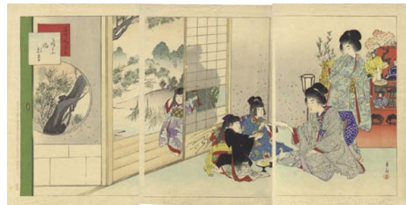
353 春汀 當世風俗通 3枚続 刷良 保存良 左図極少点シミ 明治32年 (1899) 45,000円