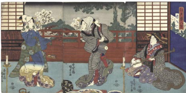
310 国貞初代 江戸姿八契 3枚続 刷良 保存良 裏打 少シミ 文化・天保期 (1815-42) 70,000 円