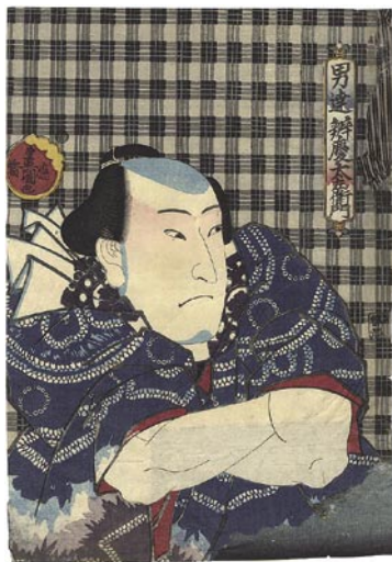
330 豊国三代 男達弁慶太左衛門 刷良 保存良 一部裏打 トリミング 右端題箋横欠損部分補修 江戸期 50,000 円