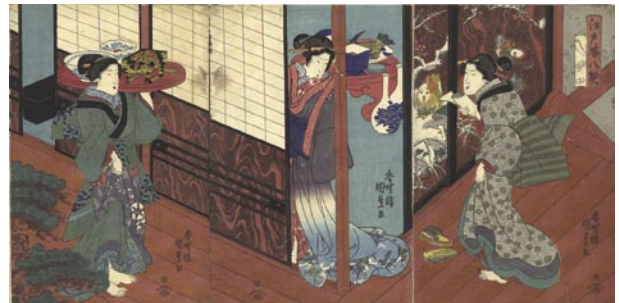
309 国貞初代 江戸姿八契 3枚続 刷良 保存良 裏打 少シミ 文化・天保期 (1815-42) 85,000 円