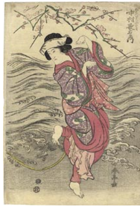
325 春亭 中村歌右衛 刷良 保存良 角薄い汚レ 文化・天保期 (1815-42) 20,000 円