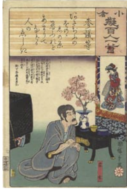
366 広重初代 参議等 / 宗玄 題箋部分少汚レ 6,000 円