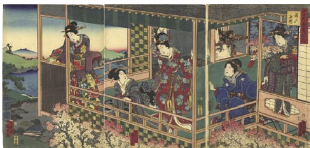
345 国貞二代 七小町吾妻風俗 清水小町 3枚続 刷良 保存良 トリミング 安政3年 (1855) 45,000 円