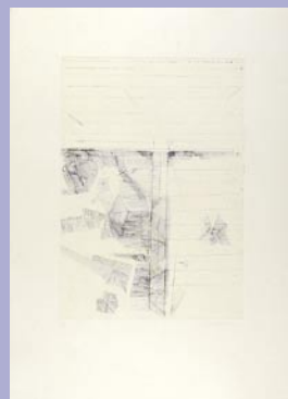
250 マージン 極薄いシミ 30,000 円