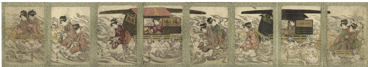
344 豊国初代 大井川蓮台渡しの図 8枚 小判 刷良 保存良 少点虫穴 帖仕立 19 × 12.5 文化・文政頃 40,000 円