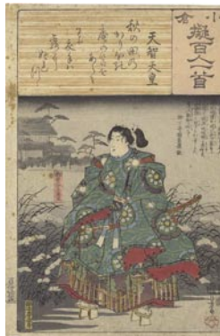
371 国芳 天智天皇 / 御曹子牛若丸 シミ 6,000 円