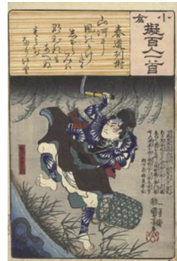
372 国芳 春道列樹 / 緒川与右エ門 右端少シミ 8,000 円