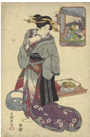
304 五湖亭 (貞景) 美人図 刷良 保存良 中折レ 端部少汚レ 文化・天保期 (1815-42) 45,000 円