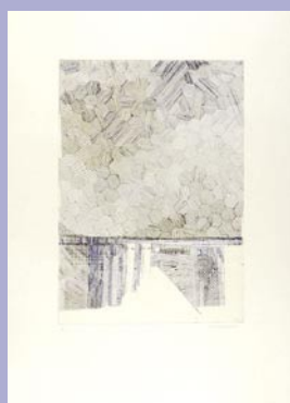
252 マージン 極薄いシミ 30,000 円