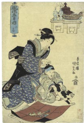
342 国貞初代 風流十二月ノ内 小春 刷良 保存良 少ヤケ ※化粧 道具・猫の図 文化・天保期 (1815-42) 30,000 円