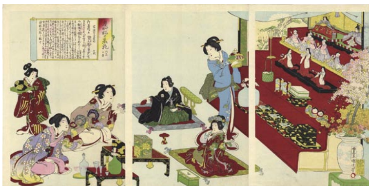
347 国周 葵艸松の裏苑 比奈の図 3枚続 刷極良 保存良 左図1ヶ所赤滲ミ 明治12年 (1879) 75,000 円