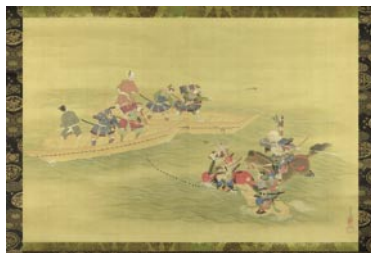
354 周之 自筆画幅 源義経・弁慶合戦図 絹本 彩色 サイン シミ 少傷ミ 57.5 × 85.5 表具傷ミ 江戸期 35,000円