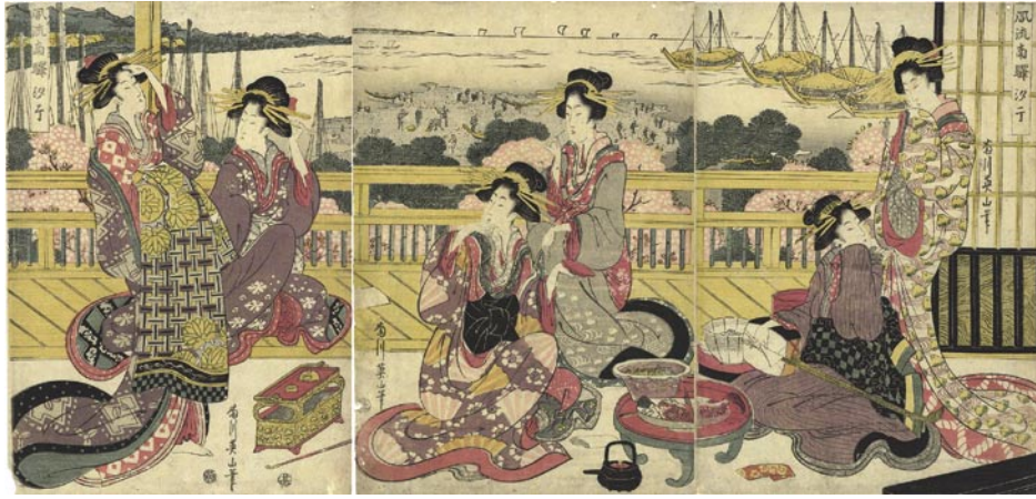
300 英山 風流南驛汐子 3枚続 刷良 保存良 極少虫穴 文化・天保期 (1815-42) 350,000 円