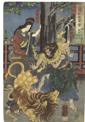
364 国芳 三国妖狐図会 南天竺乃国王班足太子怪力 刷良 保存良 トリミング 少虫穴 補修 弘化・嘉永期 (1847-52) 65,000 円