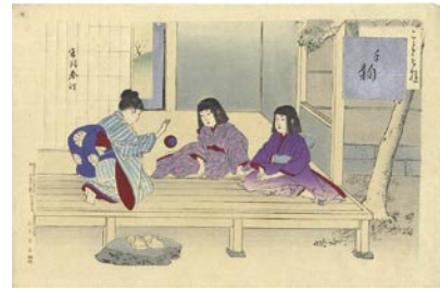
350 春汀 子ども遊 手鞠 刷良 保存良 マージン1ヶ所点シミ 明治29年 (1896) 10,000円