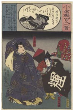
370 豊国三代 清少納言 / 菅丞相 6,000 円