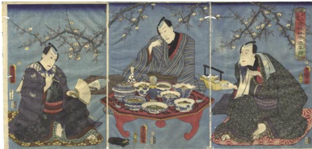
336 豊国三代 見立三国志遊梅林楽酒宴図 3枚続 刷良 保存良 裏打 少虫穴 弱い波打 安政6年(1859) 48,000円