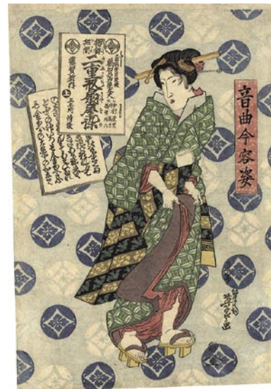
303 英泉 音曲今容姿 刷良 保存良 文化・天保期 (1815-42) 80,000 円