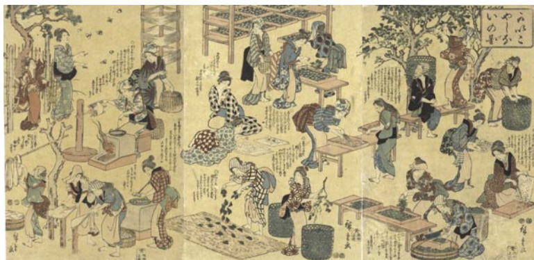
343 広重初代 かいこやしないの図 3枚続 刷良 保存良 虫穴補修 弘化・嘉永期 (1847-52) 80,000 円