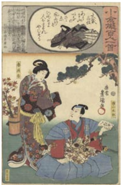
369 豊国三代 大貳三位 / 妻浅香 5,000 円