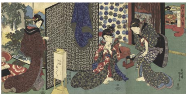
312 国貞初代 江戸姿八契 3枚続 刷良 保存良 裏打 少シミ 文化・天保期 (1815-42) 100,000 円