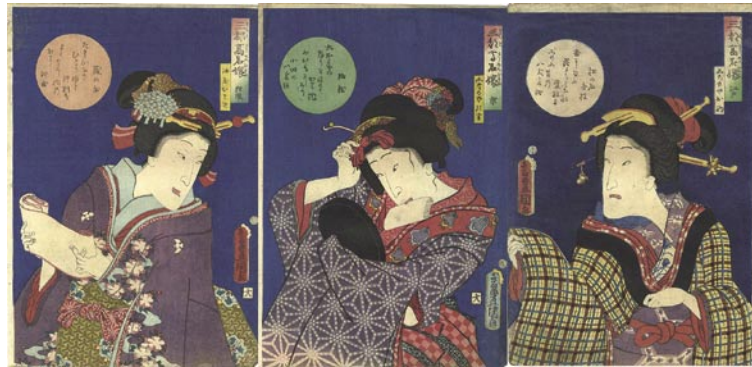
319 豊国三代 三都高名嬢 江戸 / 京 / 難波 全3枚 刷良 保存良 裏打 文久2年 (1862)