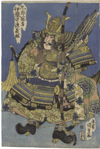
359 国貞初代 九郎冠者伊豫守源義経 刷良 保存良 文化・天保期 (1815-42) 45,000 円