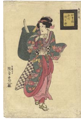
326 国貞初代 九役之内 加さね 刷良 保存良 極少虫穴 端部少傷ミ 文化・天保期 (1815-42) 20,000 円