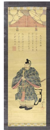
357 英泉 天満宮神詠 縦2枚 刷良 保存良 ヤケ 卷シフ 軸装 (傷ミ) 35,000円