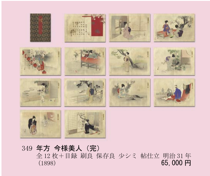
349 年方 今様美人 (完) 全12枚+目録 刷良 保存良 少シミ 帖仕立 明治31年 (1898) 65,000円