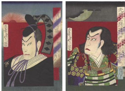
338 芳年 光明七陽盛 羽柴秀吉 / 齋藤内藏之介 2枚 刷良 保存良 トリミング 少シワ 明治9年(1876) 28,000円