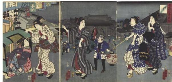
346 国貞二代 七小町吾妻風俗 せきでら 3枚続 刷良 保存良 トリミング ※二八蕎麦屋台の図 安政3年 (1855) 65,000 円