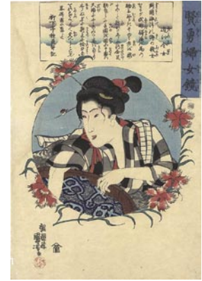
317 国芳 賢勇婦女鏡 近江令女 刷良 保存良 トリミング 薄いシミ 左端1ヶ所少切レ 天保・弘化期 (1843-47) 25,000 円