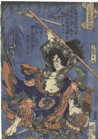
362 国芳 通俗水滸傳豪傑百八人 之一個 九紋龍史進 刷良 保存良 トリミング 文政 10年頃 (C1827) 50,000 円