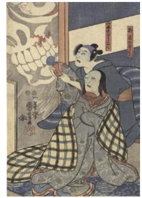
327 国芳 於岩のぼうこん 刷良 保存良 トリミング 中折レ 弘化・嘉永期 (1847-52) 25,000 円