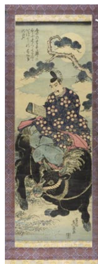
356 英泉 菅原道真 (牛乗り天神) 縦2枚 刷良 保存良 少ヤケ 卷シフ 軸装 (傷ミ) 10,000円