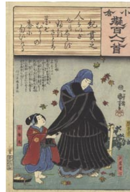
376 国芳 紀貫之 / 苅萱道心 / 石働丸 少シミ 6,000 円