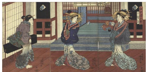
313 国貞初代 江戸姿八契 3枚続 刷良 保存良 裏打 少シミ 文化・天保期 (1815-42) 80,000 円