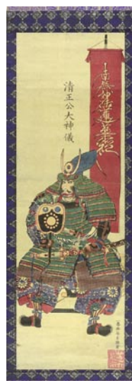
355 芳員 清正公大神儀 縦2枚 刷良 保存良 卷シフ 軸装 (傷ミ) 20,000円