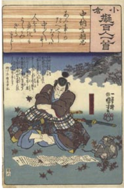
365 国芳 中納言朝忠 / 遠藤武者盛遠 マージン左下少シミ 6,000 円

小倉擬百人一首：広重・国芳・豊国三人の合作。上段に小倉百人一首の歌と絵詞を、それに見立てて下段に史話伝説を描いた百枚揃の歴史画。制作は弘化初年（1844）。刷良 保存良。