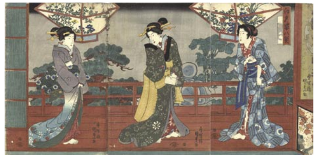
311 国貞初代 江戸姿八契 3枚続 刷良 保存良 裏打 少シミ 文化・天保期 (1815-42) 85,000 円