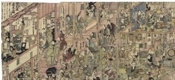
322 国貞初代 さかい町中村座楽屋之図 3枚続 刷並 保存並 裏打 トリミング 中折レ 虫穴補修 文化10年 (1813) 25,000 円