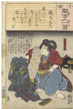
378 国芳 猿丸太夫 / 菅我箱王丸 マージン左端シミ 8,000 円