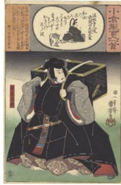
367 国芳 法性寺入道 前関白太政大臣 / 袴垂保輔 マージン上部1ヶ所シミ 8,000 円