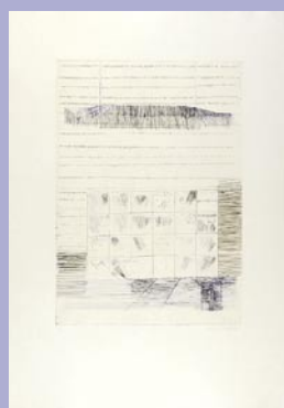
254 35,000 円