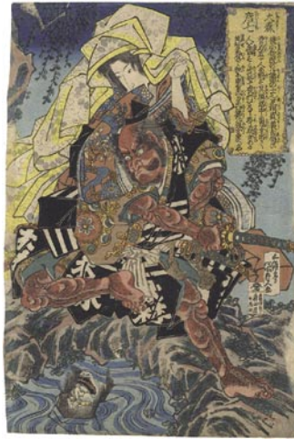
360 国貞初代 大森彦七 刷良 保存良 トリミング 右端擦レ 文化・天保期 (1815-42) 50,000 円