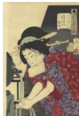
348 芳年 風俗三十二相 つめたそう文化年間 めかけの風俗 刷良 保存良 明治21年 (1888) 38,000 円