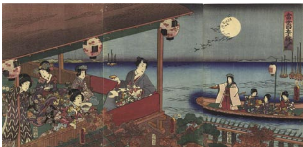
320 豊国三代 當世四季詠 秋の部 3枚続 刷極良 保存良 トリミング 安政4年 (1857) 48,000 円