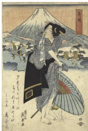
305 英泉 美人東海道 原ノ驛 刷良 保存良 薄い汚レ 文化・天保期 (1815-42) 45,000 円