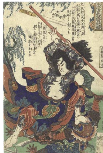
363 国芳 通俗水滸傳豪傑百八人 之一個 九紋龍史進 刷良 保存良 トリミング 文政10年頃 (C1827) 45,000 円