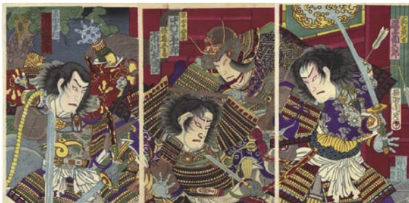
340 周延 茶臼山凱旋陣立 3枚続 刷良 保存良 ※真田幸村の図 明治13年(1880) 18,000円