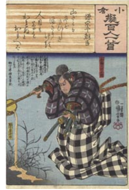
368 国芳 源宗于朝臣 / 金輪五郎今国 7,000 円