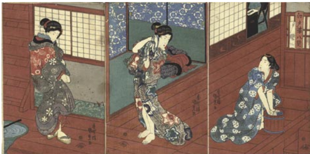
308 国貞初代 江戸姿八契 3枚続 刷良 保存良 裏打 少シミ 文化・天保期 (1815-42) 85,000 円