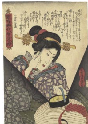
318 豊国三代 難有御代ノ賀界絵 刷良 保存良 少虫穴補修 天保・弘化期 (1843-47) 50,000 円