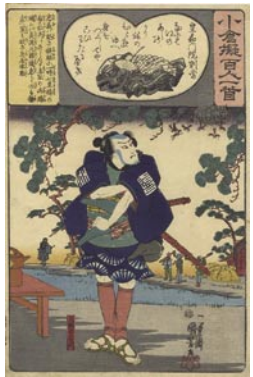
374 国芳 皇嘉門院別當 / 足軽市右エ門 6,000 円