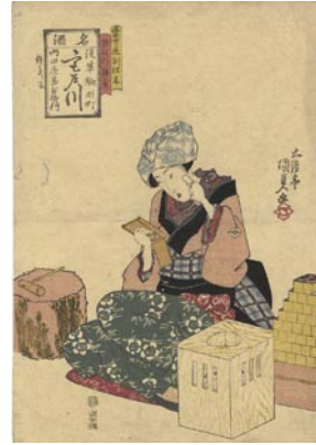
316 国貞初代 當世庭訓往来 駒形乃諸白 刷良 保存良 中折レ 少虫穴 ※酒の見出し 文化・天保期 (1815-42) 20,000 円