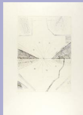
251 35,000 円