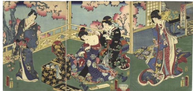
321 国貞二代 江戸紫源氏模様 3枚続 刷良 保存良 ※白粉塗りの図 万延元年 (1860) 45,000 円