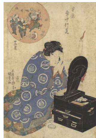
306 国貞初代 吉原年中行事 十二月 刷良 保存並 トリミング シミ ※化粧の図 文化・天保期 (1815-42) 28,000 円