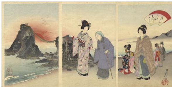
352 延一 二見ヶ浦日の出 3枚続 刷良 保存良 極薄いシミ 明治30年 (1897) 25,000円