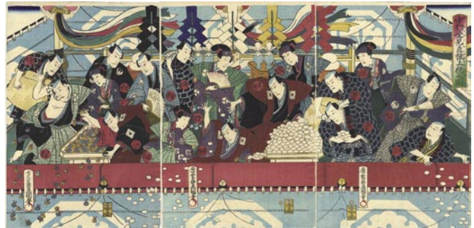
339 豊国三代 中村座見立棟上祝之図 3枚続 刷良 保存良 元治元年(1864) 60,000円