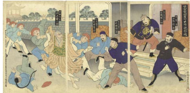
341 豊齋 東京市村座於テ大詰メ訊問之場(戦争外聞記) 3枚続 刷良 保存良 ※川上音二郎の図 明治27年(1894) 45,000円