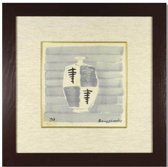
246 バーナード・リーチ 自筆画 扁壺図 紙 淡彩 サイン シミ 浜田晋作シール 24.5 × 26 昭和 38 年 (1963) 額装 180,000 円