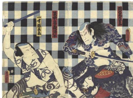
334 豊国三代 夏祭意気地江戸ッ子 2枚 刷良 保存良 左図端傷ミ ※刺青の図 安政5年(1858) 20,000円