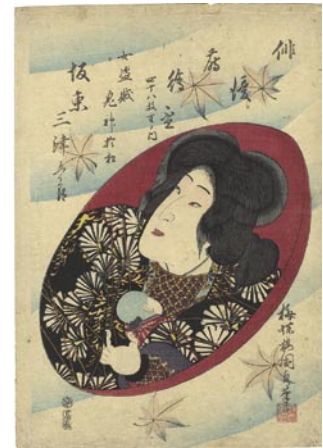
335 国貞二代 俳優蔭絵盃 女盜賊鬼神於松(坂東三津五郎) 刷良 保存良 少シミ 文久3年(1863) 10,000円