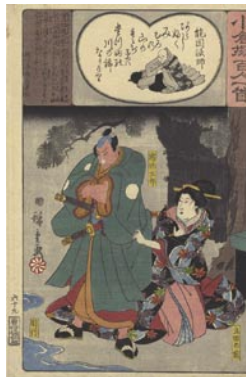
379 広重初代 能因法師 / 宿弥太郎 / 立田の前 6,000 円