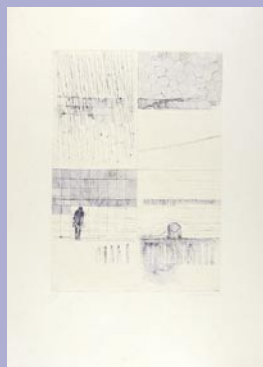
249 マージン 1ヶ所点シミ 30,000 円