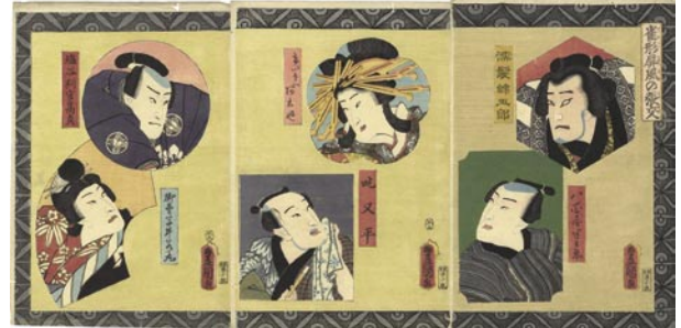
329 豊国三代 雀形屏風の張交 3 枚続 刷良 保存良 安政 5 年 (1858) 18,000 円