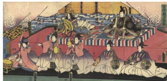
323 豊国三代 古今雛の段幕 3枚続 刷良 保存良 嘉永4年 (1851) 45,000 円