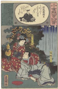
373 豊国三代 源俊頼朝臣 / 雲のたへま / 鳴神上人 6,000 円