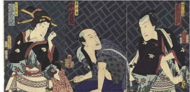
337 国周 猿廻門途の一颯 3枚続 刷良 保存良 裏打 トリミング 文久2年(1862) 8,000円