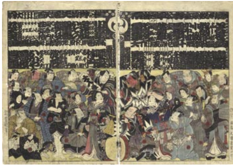
333 豊国三代 役者番付 2枚続 刷良 保存並 裏打 少傷ミ 少シワ 安政4年(1857) 25,000円