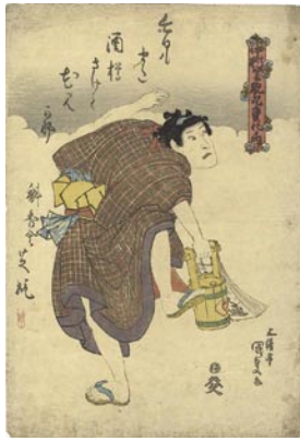
324 国貞初代 中村芝翫 九変化ノ内 刷良 保存並 シミ 少虫穴 文化・天保期 (1815-42) 18,000 円